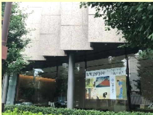
上：雁行している西側全景 下：1階ガラス張りのcafe

建物概要 設計：日本設計 延床面積：4,358㎡ 規模：地下1階、地上6階 構造：S造、SRC造 竣工：2009年 住所：渋谷区広尾3丁目